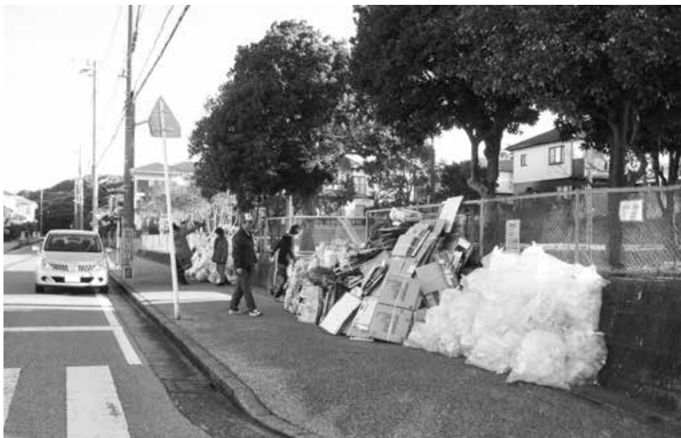
資源ごみ回収の世話をする自治会役員

どこの地域自治会内にも元気なお年寄りが多くいます。そうした皆様と自治会とで話し合い自分たちができる範囲の中で週の1日でも2日でも開館していくことは可能だと思います。一方、地域