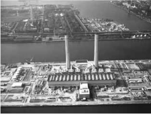
現在の東電千葉火力発電所

費をまかなうものであった。さらにこれはその後の千葉県の東京湾岸部に造成・稼働された京葉臨海工業地帯（コンビナート）の先駆 さきがけ をなすものとなった。